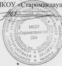
ГРАФИК РАБОТЫ ответственных преподавателей ученической бригады (на пришкольном участке). Лето 2024